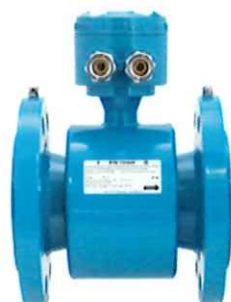
Датчик расхода модели Метран-370MR (с соединительной коробкой)