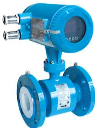
Измерительный преобразователь интегрального монтажа (с датчиком фланцевого исполнения)