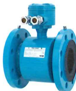
Датчик расхода моделей Метран-370MF, Метран-370MS, Метран-370MP (с соединительной коробкой)