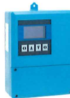
Измерительный преобразователь удаленного монтажа настенного исполнения