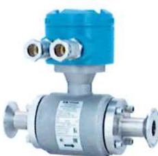
Датчик расхода модели Метран-370MH (с соединительной коробкой)