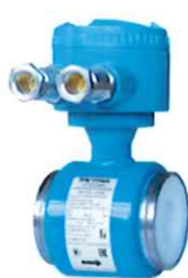
Датчик расхода модели Метран-370MW (с соединительной коробкой)