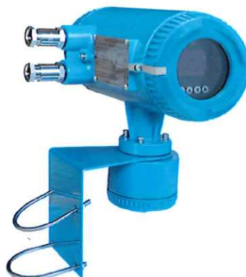
Измерительный преобразователь удаленного монтажа для крепления на кронштейне