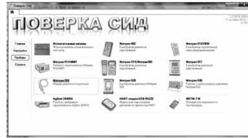
Рис.3. Главное окно программы.

ПО "Поверка СИД" является автономным ПО и аттестовано на соответствие требованиям ГОСТ Р 8.654-2015.