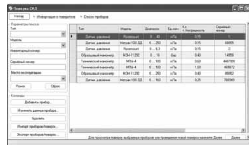
Рис.4. Выбор приборов для поверки и просмотра информации.

Выбор приборов (с сохраненными ранее данными по нему) для периодической поверки осуществляется из имеющейся базы данных или вводятся данные о новом приборе (тип, модель, инвентарный и серийный номер, диапазон измерений, пределы допускаемой погрешности, ряд поверяемых точек и т.п.). Возможен поиск одного или нескольких приборов в базе данных.