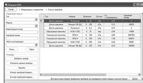
Рис.4. Выбор приборов для поверки и просмотра информации.

Выбор приборов (с сохраненными ранее данными по нему) для периодической поверки осуществляется из имеющейся базы данных или вводятся данные о новом приборе (тип, модель, инвентарный и серийный номер, диапазон измерений, пределы допускаемой погрешности, ряд поверяемых точек и т.п.). Возможен поиск одного или нескольких приборов в базе данных.