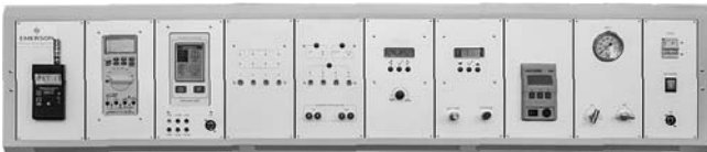
Рис.2. Пример внешнего вида надстройки стенда для поверки до 4 датчиков с автоматическим регулятором давления и набором функциональных панелей со встроенным оборудованием для ремонта датчиков.

Характеристики и подробное описание оборудования и эталонов, сформированного специалистами АО "ПГ "Метран" как комплект стенда, см. в соответствующих разделах данного каталога (по запросу направляется совместно с обозначением комплекта стенда).