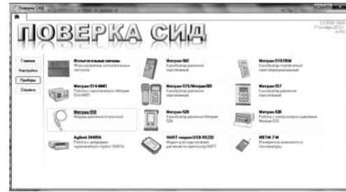
Рис.3. Главное окно программы.

ПО "Поверка СИД" является автономным ПО и аттестовано на соответствие требованиям ГОСТ Р 8.654-2015.