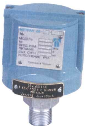
Рисунок 1 – Общий вид датчика давления Метран-55

Датчики имеют измерительный блок с тензорезисторным или емкостным преобразователем входной величины и аналоговый или микропроцессорный электронный преобразователь.