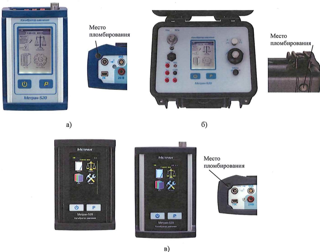
Рисунок 1 – Калибраторы давления Метран-520: а) калибратор портативного исполнения, модификация LCD; б) калибратор кейсового исполнения; в) калибратор портативного исполнения, модификация TFT;

Внешний вид калибраторов и место размещения защитной пломбы представлены на рисунке 1.